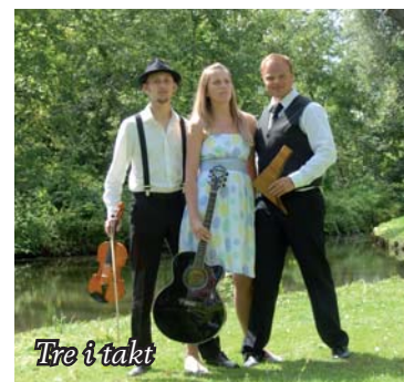
Tre i takt