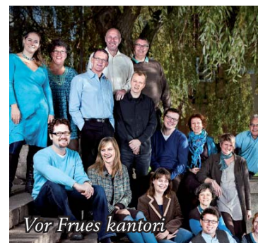
Vor Frues kantori