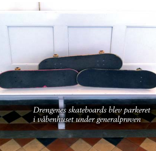
Drengenes skateboards blev parkeret i våbenhuset under generalprøven

En af drengene sagde efterfølgende til sin mor: "Ved du hvad mor, jeg kan faktisk rigtig godt lide at være i kirken. Man bliver sådan helt rolig og afslappet derinde. Det er et rigtig godt sted at være!"