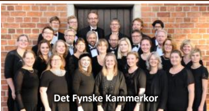
Det Fynske Kammerkor