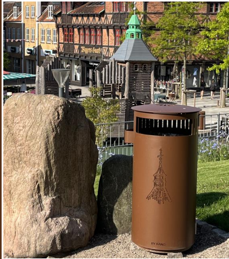
Nye skraldespande ved Vor Frue Kirke

August · September · Oktober · November 2026