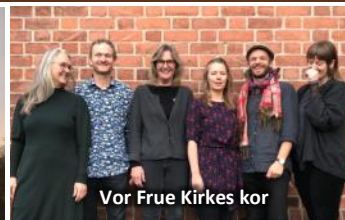
Vor Frue Kirkes kor