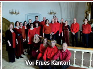
Vor Frues Kantori