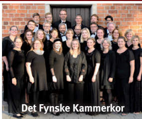
Det Fynske Kammerkor